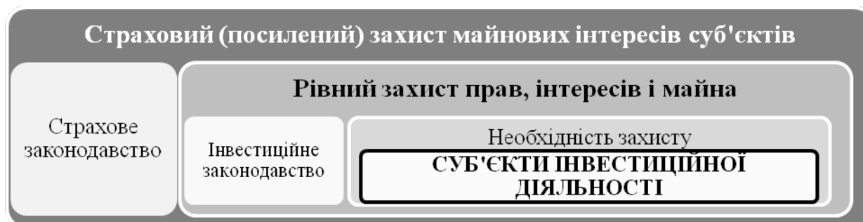
Рис. 3. Взаємозв'язок видів захисту суб'єктів інвестиційної діяльності

Важливість активізації інвестиційної діяльності для сучасного вітчизняного соціально-економічного розвитку важко переоцінити, але її складність як фінансово-господарського процесу передбачає високу ймовірність виникнення необхідності у відшкодуванні збитків як фінансового показника, так і заподіяної шкоди технологічного, техногенного характеру тощо, що сформуються в результаті настання таких випадків (подій). Це врегульовано нормами права, а саме інвестиційним законодавством [12], спрямованим на забезпечення рівного захисту прав, інтересів і майна суб'єктів інвестиційної діяльності; страховим законодавством [13; 14; 15], спрямованим на посилення страхового захисту майнових інтересів підприємств, установ, організацій та громадян. Тобто суб'єкти інвестиційної діяльності виступають або можуть виступати суб'єктами страхових правовідносин (рисунок 3), а страховий захист виступає фактором посилення активності суб'єктів правовідносин у напрямку здійснення інвестиційної діяльності.