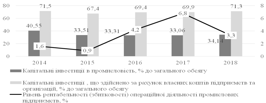
Рисунок 2. Аналіз капітальних інвестицій за видами економічної діяльності та джерелами фінансування [3; 4]

Як видно з проведеного аналізу динаміки капітальних інвестицій за видами економічної діяльності та джерелами фінансування, близько 70 % усіх капітальних інвестицій в Україні здійснено за КВЕД В+C+D+E «Промисловість». Більше 30 % капітальних інвестицій у державі здійснено за рахунок власних коштів підприємств та організацій. Але не виявлено закономірності між стабільним зростанням динаміки сум капітальних інвестицій, які переважно вкладені в промисловість, та рентабельністю промислових підприємств, що має як позитивні, так і негативні тенденції за досліджуваний період.