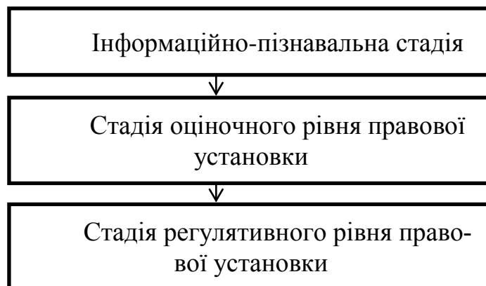
Рис. 2. Етапи (стадії) процесу деформації правосвідомості

Розглянемо процес деформації правосвідомості на рис. 2