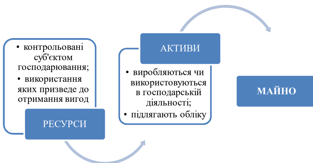
Рис. 2. Визначення терміна «майно» у сфері господарювання за процесним підходом

Тому визначення сутності терміна «майно» у сфері господарювання пропонується розглядати за процесним підходом, який наведено на рисунку 2.